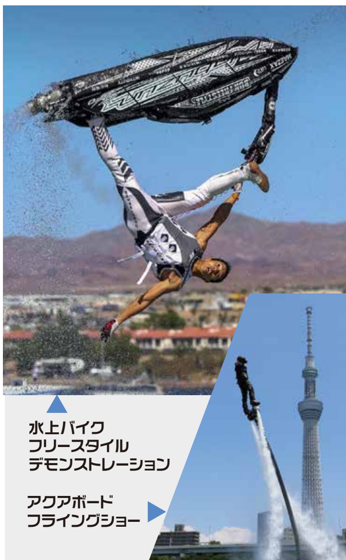
水上バイク フリースタイル デモンストレーション