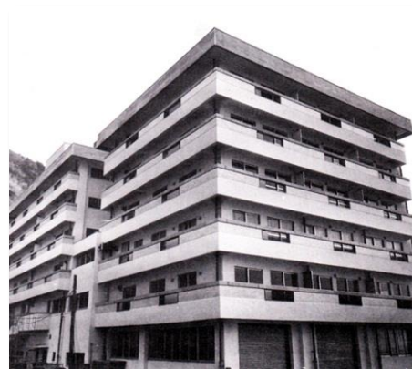
湘南研修所 神奈川県逗子市小坪