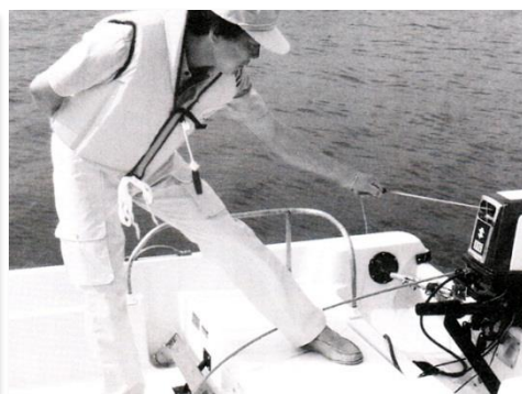
身体標準検討委員会の実艇による検討風景