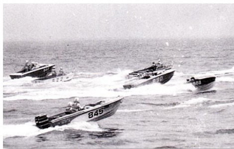
第1回熱海オーシャンカップモーターボートレース